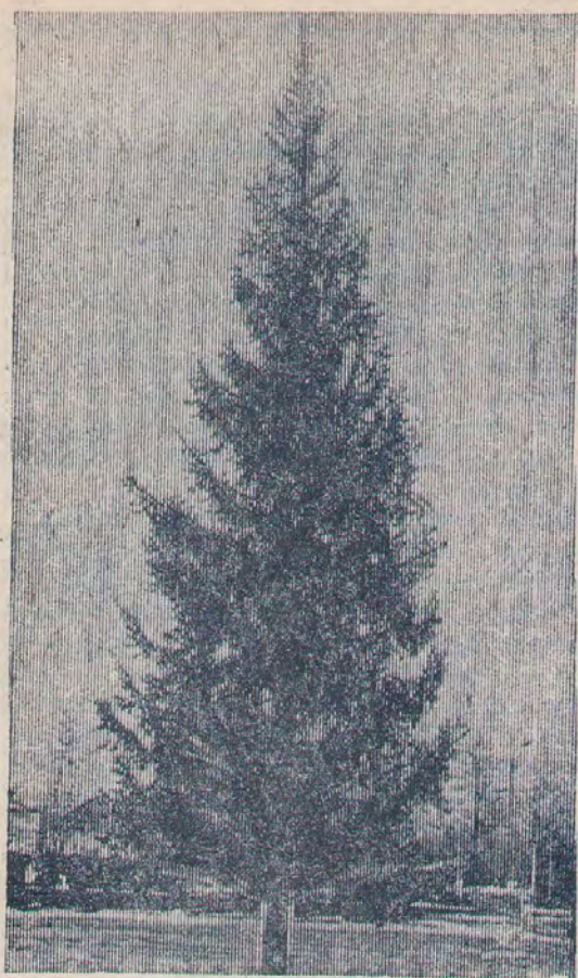
ГЛАВНАЯ ЕЛКА РАЙОНА.