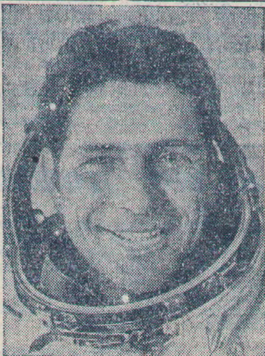
Экипаж космического корабля «Союз-32» — командир корабля подполковник Владимир Афанасьевич Ляхов (на левом снимке) и бортинженер-лётчик-космонавт СССР Валерий Викторович Рюмин.

Высокое качество — это сбережение труда и материальных ресурсов, рост экспортных возможностей, а в конечном счете, лучшее, более полное удовлетворение потребностей общества — отмечалось на XXV съезде КПСС. Об этом должны постоянно помнить в каждом трудовом коллективе.