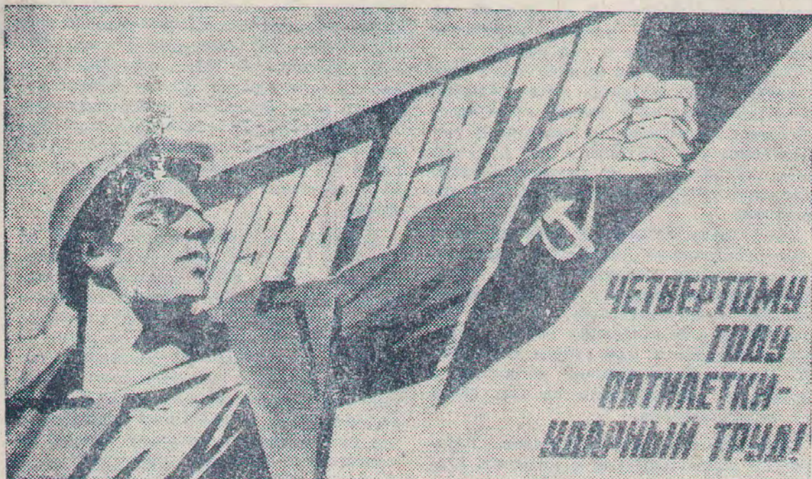
Плакат художника В. Кононова. (Фотохроника ТАСС)