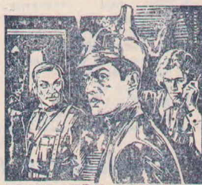
ФИЛЬМ ПОД СОЛНЦЕМ

«Пыль под солнцем» — новый историко-революционный фильм о ликвидации контрреволюционного мятежа, поднятого в Симбирске в июле 1918 года левым эсером Муравьевым, явившимся в то время командующим Восточным фронтом Красной Армии. В центре фильма образы главы симбирских большевиков, талантливого революционера-большевика, сына литовского народа Иосифа Михайловича Варейкиса и командующего Первой армией Михаила Николаевича Тухачевского.