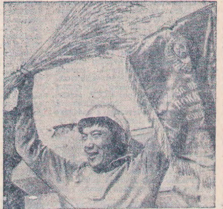
1978 г. Есть миллиард пудов казахстанского хлеба!

В первые годы целинные земли в основном осваивались в северных областях. Сей-