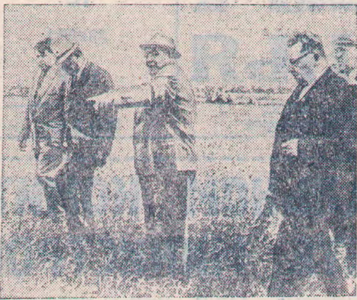
Л. И. Брежнев в целинном совхозе.

высшего качества — сильных и твердых сортов. Казахстан прочно закрепил за собой роль основного поставщика сильных и ценных пшениц.