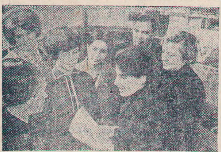
Краснодарский край. В колхозе имени Кирова Каневского района хорошо поставлена политическая и экономическая учеба. А это во многом способствует и успехам на производстве.

ции СССР, документов партии в связи с подготовкой и проведением 60-летия Великой Октябрьской социалистической революции, требований июльского (1978 г.) Пленума ЦК КПСС и других материалов, рассматривается о развитии устной политической агитации на различных этапах деятельности КПСС, о роли, содержании и основных направлениях агитации в современных условиях, ее организационных формах и некоторых вопросах методики, о партийном руководстве агитационно-массовой работой. Книга рассчитана на агитаторов, политинформаторов, докладчиков.