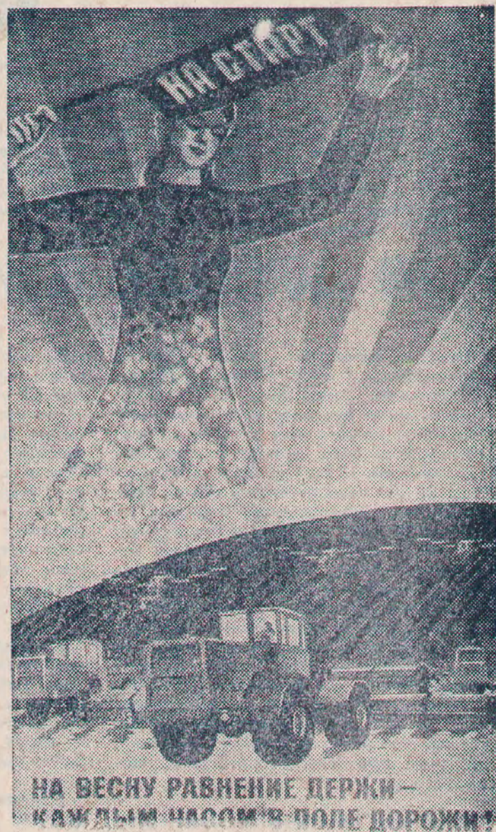
Плакат художника В. Удода. Издательство «Плакат».

В составе комплексов действуют партийные группы. Это они призваны всячески содействовать высокоэффективной работе комплексов, вовремя замечать и давать принципиальную оценку фактам нарушения срока и качества работ. В комплексе, как в оркестре, должны работать в унисон все механизмы, все звенья. Впереди у земледельцев — сев свеклы, подсолнечника, кукурузы, кормовых культур. Необходимо дорожить каждым часом. Сэкономленное время на полевых работах окупится высоким урожаем.