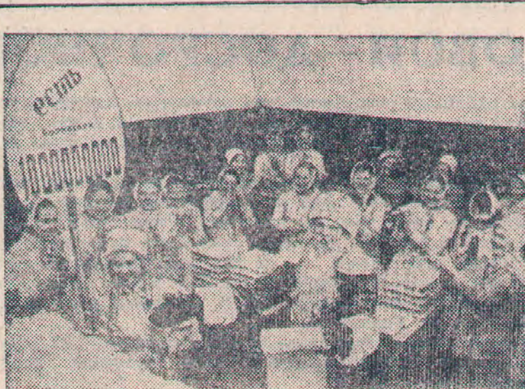
Тюменская область. Миллиард яиц снесли за три года хохлатки Боровской птицефабрики — больше, чем за всю предыдущую пятилетку. С этим приятным событием птицеводов поздравил Дед Мороз.