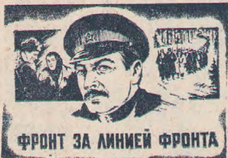
ФРОНТ ЗА ЛИНИЕЙ ФРОНТА

Скоро на экраны кинотеатров района выйдет новый художественный двухсерийный фильм «Фронт за линией фронта», производство «Мосфильм».