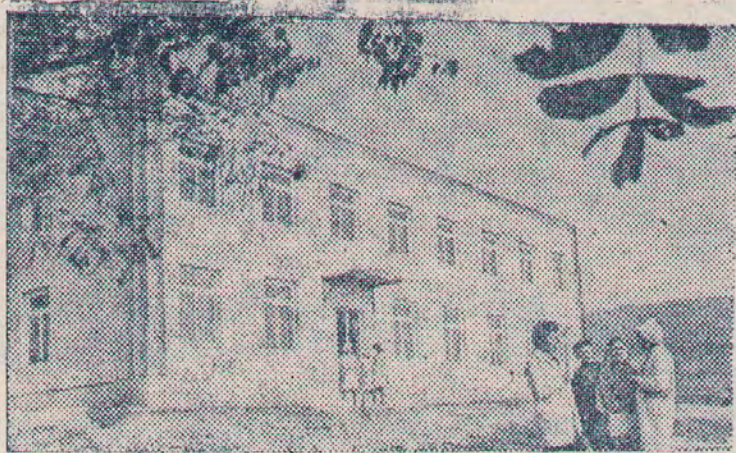
Молдавская ССР. Домом здоровья назвали жители села Селиште