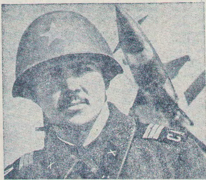
На страже мирного неба Родины.