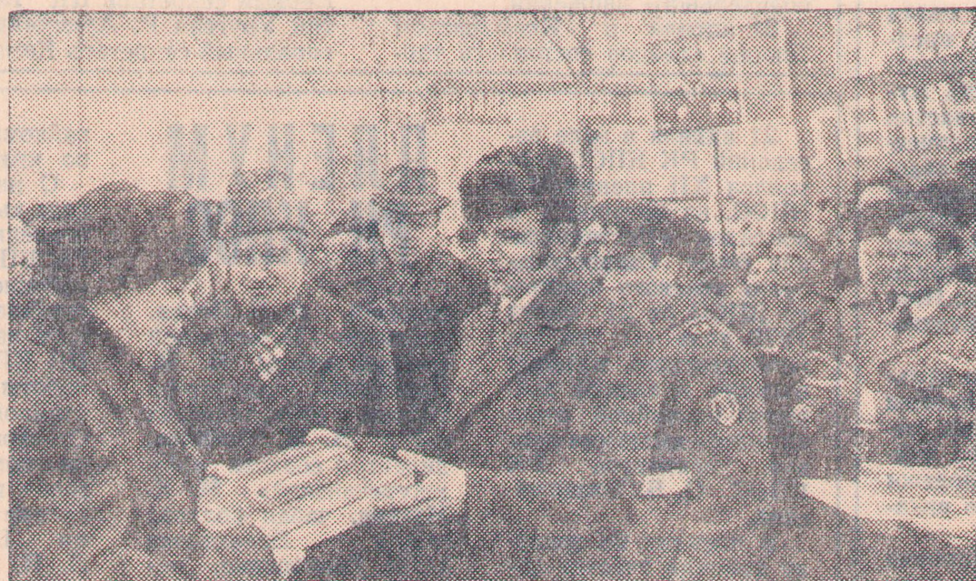
АМУРСКАЯ ОБЛАСТЬ. Станция Сковородино. Встреча Леонида Ильича Брежнева с отрядом комсомольцев — передовиков-строителей центрального участка БАМа.