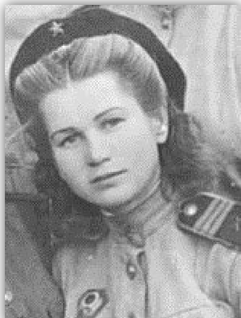
Фото 1944 года

Родилась 13 февраля 1924 года в селе Поречье Минской области Белорусской ССР. Образование среднее медицинское. Была призвана на фронт в июне 1943 года Невинномысским РВК. Воинское звание: лейтенант медицинской службы. Должность: медсестра, ЭГ № 2244, 3016, 90 зап. зенитно-арт. полк. Воинская часть: 2 Украинский фронт. Инвалид 2 группы по общему заболеванию. Демобилизовалась в 1945 году.